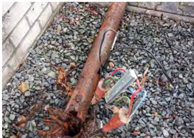
Zjištěný havarijný stav u jednoho ze stožárů VO

Cílem dokončeného projektu je zvýšit energetickou účinnost systému veřejného osvětlení v obci Šes-