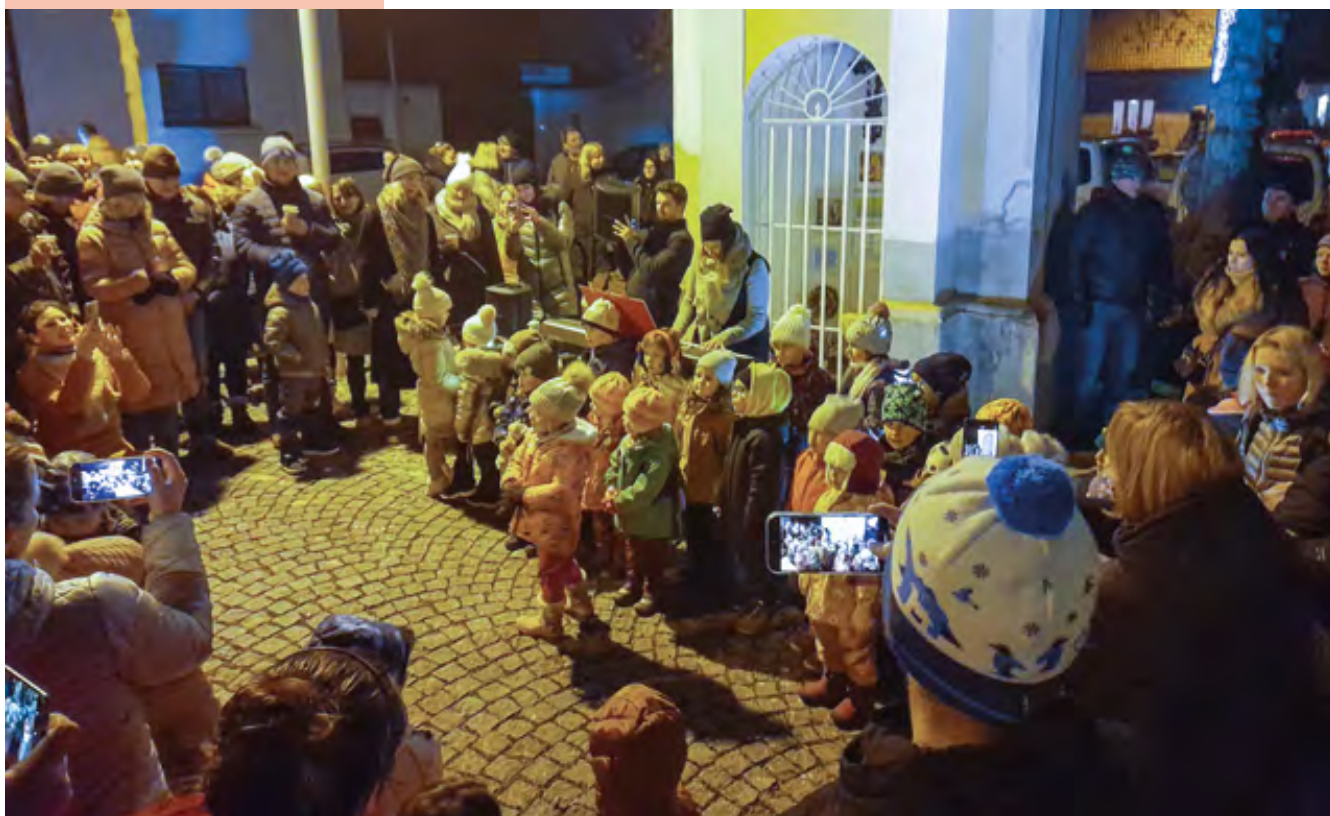
1. prosinec 2024, Předvánoční setkání – zpívání u vánočního stromu