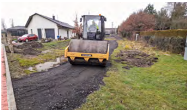
Hutnění nové cesty pro pěší

Nyní dochází k úpravám, které navazují na horní část této propojky. V její horní části se nachází příjezdová komunikace pro rodinný dům. Dolní část pak bude celá zrevitalizována. Jako první zde obec nedávno nově zasadila několik stromů. Nyní zde technické služby obce budují cestu, která bude sloužit pouze pro chodce. Tato cesta je tvořena drceným materiálem. Cesta již byla zhutněna. Následovat bude zarovnění jejích okrajů. Dále proběhnou terénní úpravy, na které bude navazovat ozelenění plochy. Kromě travnaté plochy zde bude výsazeno i několik keřů.