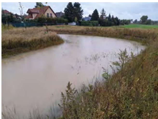
Hlavní část příkopu pro záchyt vody z pole