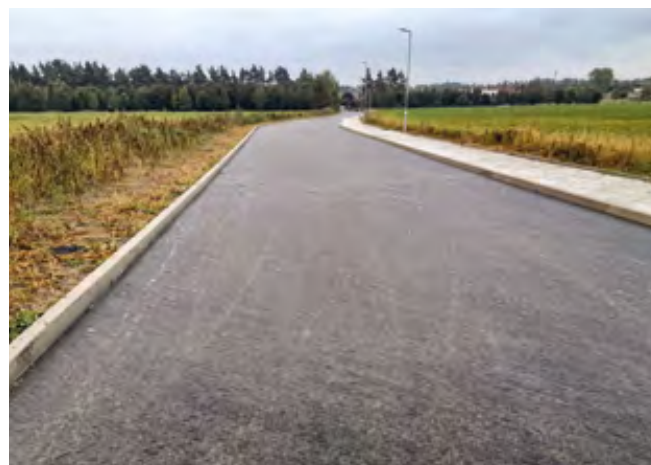
Dokončená nová komunikace v ulici Potoční

Aktuální stav: Nová silnice, chodník a veřejné osvětlení dokončeny.