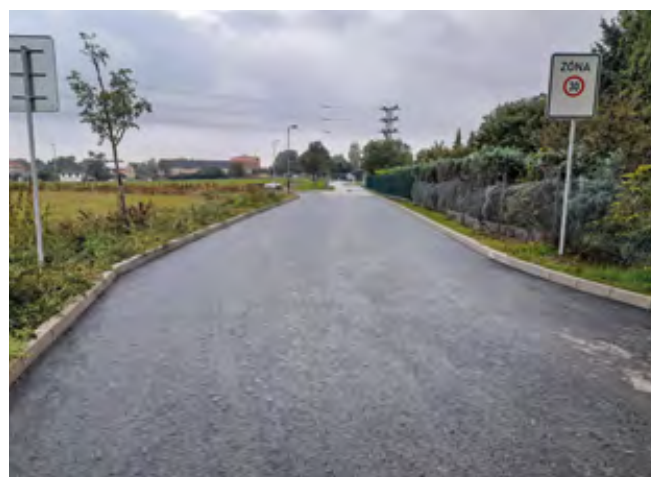
Nová komunikace v ulici Nad Údolím

Komunikace Nad Údolím navazuje na ulici Potoční. Proto aby bylo spojení s hlavní silnicí kompletní , byla vybudována nová silnice i v této ulici. Část silnice určená pro spojení s hlavní komunikací (dále přes ulici Lipová) bude vybudována ze stejného povrchu jako ulice Potoční, tedy z asfaltu. Druhá část ulice, která slouží