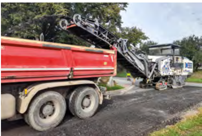
Frézování starého povrchu silnice v ulici Lipová

Aktuální stav: Na straně ulice patřící do katastru obce Šestajovice byly vybudovány nové obrubníky a vjezdy. Obec Jirny zahájí budování obrub na své straně ulice. V rámci přípravy pokládky nové asfaltové vrstvy byla vyfrézována vrchní vrstva původního asfaltu. Pokládka nového asfaltu proběhne v průběhu příštího měsíce.