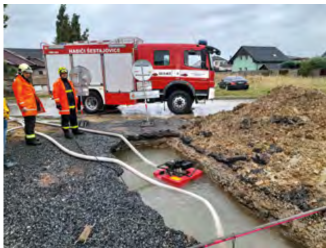
Šestajovičtí hasiči při odčerpávání vody z poškozeného řadu

V Šestajovicích tak byly škody menší míry. Šestajovičtí hasiči v souvislosti s dešti zaznamenali dva výjezdy . První se týkal zatékání vody do domu, druhý závady na vodovodním řadu . Tato závada byla způsobena sesuvem podmačené půdy do výkopu, který byl proveden kvůli nové přípojce vody. Sesunutá zemina urazila koncovku vodovodního řadu a z té začala vytékat voda. Ta brzy zaplnila celý příkop. Zatímco hasiči čerpali vodu, byl povolán zaměstnanec technických služeb, aby uzavřel větev řadu, která byla poškozena. Poté došlo k úplnému odčerpání vody z příkopu.