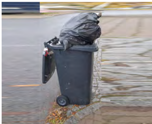
Takto přeplněná nádoba nebude vyvezena

Pro nevyvezení nádobu na směsný odpad existuje několik důvodů, proč nebyla vyvezena. Např. nádoba není označena platnou svozovou známkou, svozová známka neodpovídá termínu svozu, svozová známka neodpovídá objemu nádoby, obsah nádoby přesahuje její objem (víko nádoby není kvůli navršenému odpadu dovržené), obsah nádoby neodpovídá jejímu určení (obsahuje tříděný odpad, nebezpečný odpad apod.). Pozor: Dle obecně závazné vyhlášky obce je třídění odpadu povinné. Proto nemusí být vyvezena nádoba na směsný odpad, pokud obsahuje tříděný odpad. U nádob na tříděný odpad bývá hlavním důvodem nevyvezení, že nádoba obsahuje odpad, který do této nádoby nepatří.