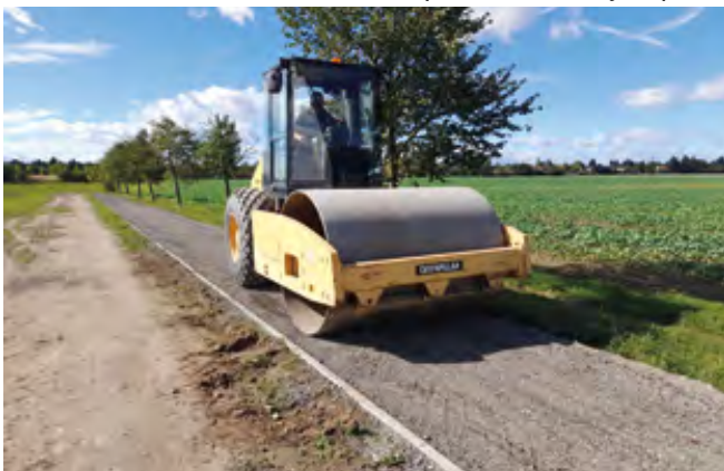
Silnice již jen čeká na finální pokládku asfaltu

Ulice Běchovická končila asfaltovou silnicí k poslednímu rodinné domu v této ulici. Dále pokračovala vyšlapaná