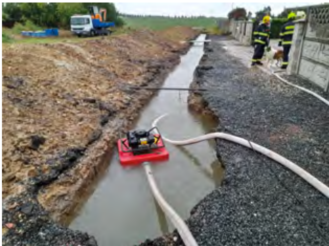
Voda zaplnila celý výkop

tímco v minulosti se voda z přilehlého pole při silných deštích valila do ulice Spojovací a K Lukám, nyní byla všechna zachycena v příkopu. Nezpůsobila tak žádné škody ani na obecním majetku ani našim občanům.