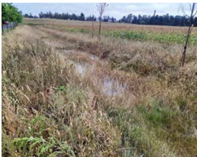
Část vody zachycují již malé přehradky v příkopu

tímco v minulosti se voda z přilehlého pole při silných deštích valila do ulice Spojovací a K Lukám, nyní byla všechna zachycena v příkopu. Nezpůsobila tak žádné škody ani na obecním majetku ani našim občanům.