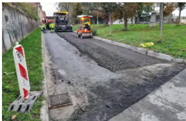
Budování základů napojení silnice Nad Údolím

Rekonstrukcí prošla také krátká komunikace, která tvoří propoj mezi ulicemi Komenského a Nad Údolím. Přípravu pro pokládku nového asfaltu zde provedly technické služby obce. Nejprve byly zaříznuy okraje přiléhajících asfaltových silnic. Dále došlo k vyzvednutí dešťové vpusti, aby seděla k nové výšce povrchu vozovky. Následně se vyrovnávaly základy pro nový asfalt. Ten byl již také položen a rekonstrukce této komunikace tak byla dokončena.