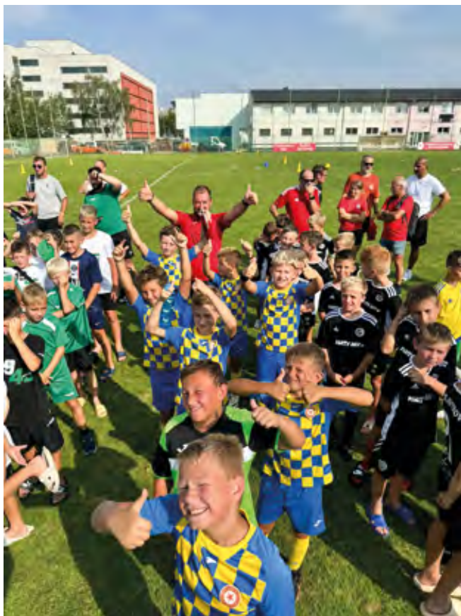
Nyní se těšíme na naše mistrovské zápasy ve skupině. Trenéři M&M