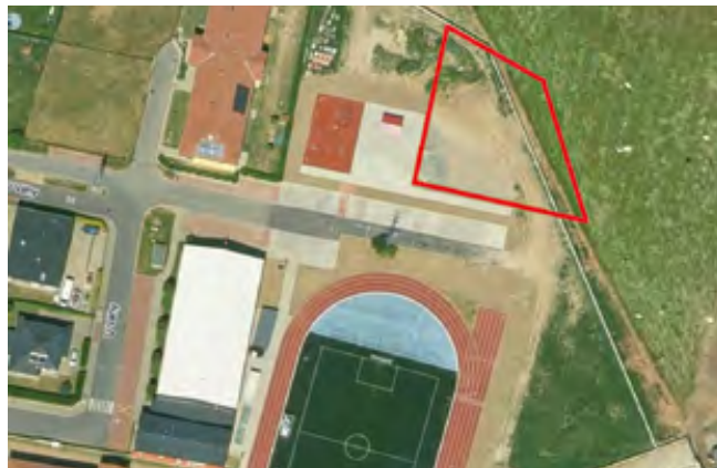
Prostor pro nový skatepark

Stavební firma již založila staveniště. Byly zahájeny zemní práce. Nový skatepark bude dokončen v průběhu příštího roku. Cena nového skateparku je 5 mil. Kč.