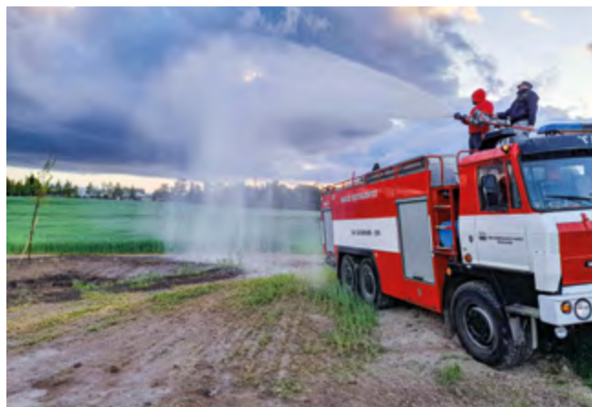
Naši hasiči nový výsev pravidelně skrápějí

Celá akce vznikla jako občanská aktivita , která je realizována prostřednictvím obce a je zaštitěna místním spolkem Atlet Šestajovice. Zásadní pak byla ochota majitelky pole část svého pozemku na vybudování příkopu obci poskytnout (obec s majitelkou uzavřela dlouhodobou smlouvu za symbolickou 1 Kč). Na akci také finančně přispělo několik firem a občanů naší obce. Celkem již poskytli finanční dary v celkové výši 197.000 Kč. Případní zájemci o přispění na tuto akci se mohou obrátit na místostarostu obce (místostarosta@sestajovice.cz). Obec děkuje všem účastněným za jejich přispění ke vzniku a vybudování projektu.