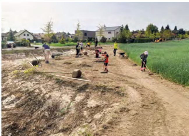
Členové Atlety Šestajovice při výsadbě nové zeleně

Na podzim bude pokračovat výsadba ovocné aleje , která bude příkop lemovat. Na jaře příštího roku bude dokončena horní část příkopu.