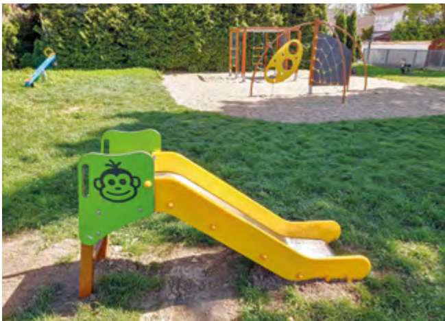
Nová skluzavka na dětském hřišti U Vrby

Obec provedla rekonstrukci dětského hřiště U Vrby (ulice 9. května). U původních prolézacích prvků byl doplněn kačírek v dopadové ploše. Zvýšila se tak vrstva materiálu tlumícího případný pád dítěte. Byla odstraněna původní kyvadlová houpačka. Byla ve stavu, kdy její další udržování v bezpečném stavu bylo již neekonomické. Místo této původní houpačky byla pořízena houpačka nová . Také přibyl jeden nový herní prvek . Tímto prvkem je skluzavka. Pořízena byla skluzavka pro děti od 1 roku. Obec tak vyšla vstříc přání maminek , které zde chtěli prvek právě pro nejmenší děti. Upraven ještě bude plot hřiště. Do oplocení bude instalována brána, aby mohly do prostoru hřiště vjíždět technické služby obce sekacím traktůrkem. Bude tak zajištěna lepší péče o travnatou plochu hřiště.