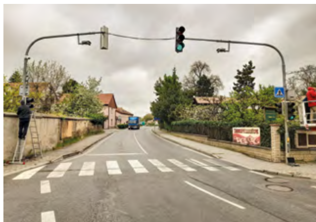
Semafor již s novými moderními svítidly