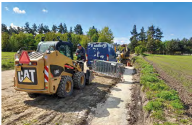
Práce na nové silnici v ulici Potoční

Začala výstavba nové silnice v ulici Potoční . Jedná se část komunikace vedoucí přes pole a navazující na stávající zastavěnou část ulice.