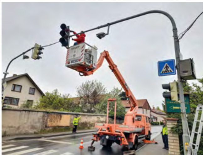
Demontáž starých svítidel semaforu

V letošním roce začal být tento semafor značně poruchový. Protože toto místo využívá k přechodu hlavní silnice mnoho dětí při cestě do školy, bylo nutné tento problém rychle vyřešit. I přes opakované opravy semafor často nefungoval. Proto se obec rozhodla udělat jeho celkovou modernizaci . V rámci této modernizace byla kompletně vyměněna všechna svítidla . Stará svítidla, s klasickými žárovkami, nahradila moderní ledková. Ta mají mnohem nižší poruchovost a několika-