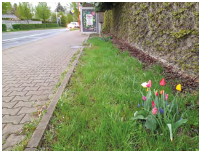
Barevné ostrůvky květin u autobusové zastávky

V rámci péče o zeleň vysázely technické služby obce toto jaro 50 nových stromů . Část těchto stromů nahra-