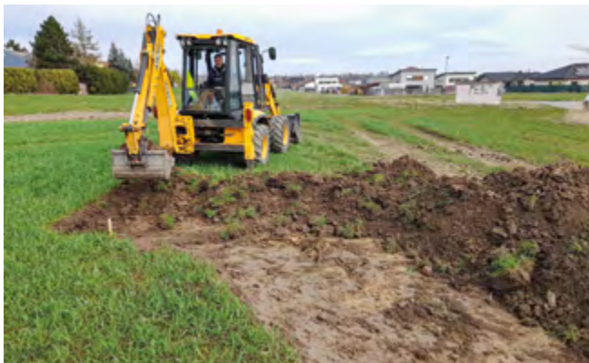
Pan Luděk z TS zahájil práce na novém příkopu

Práce začaly v polovině března bagrováním nejspodnější části příkopu, zde bude hlavní záchytná část. Tu tvoří prohlubeň a val. Po dokončení této části se bude pokračovat podél hranice pole vybudováním příkopu se záchytnými hrázkami. Celé příkop bude nakonec osá-