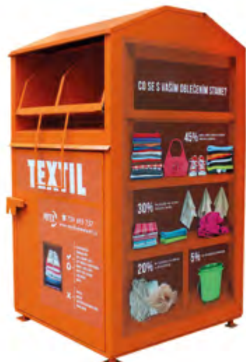
Kontejner na použitý oděv

Nejjednodušší a nejrychlejší způsob, jak poslat takovéto