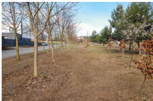
Plocha po základních úpravách