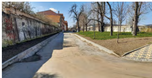
Nově upravená část ulice Nad Údolím.

V návaznosti na vybudování nových obrub byly také provedeny parkové úpravy přilehlých ploch. V průběhu roku bude dokončen asfaltový povrch. Jeho vybudování bude v rámci finančních úspor provedeno současně s jinou akcí v obci, během které bude prováděno budování nového asfaltového povrchu.