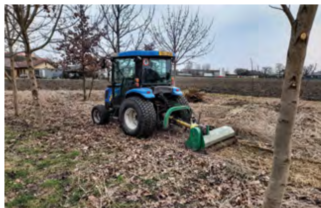
Pan Jan z TS při cepování zelené plochy