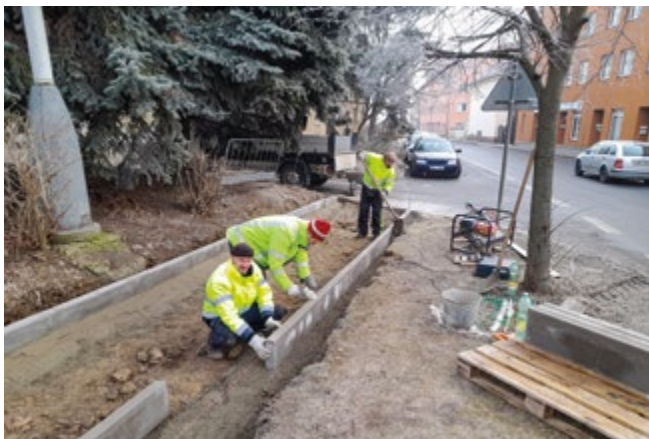
Páni Radek, Karel a Luděk z TS při rekonstrukci chodníku

Chodník byl původně tvořen betonovými dlaždicemi. Ty byly odstraněny, a to včetně původních obrub. Technické služby již provedly výkopové práce. Usazeny byly nové obrubníky. Aktuálně se dělají nové podkladové vrstvy pro novou pochozí plochu, která bude nově tvořena zámkovou dlažbou. Rekonstrukcí tohoto chodníku dojde k ukončení kompletní rekonstrukce chodníku v blízkosti budovy základní školy.