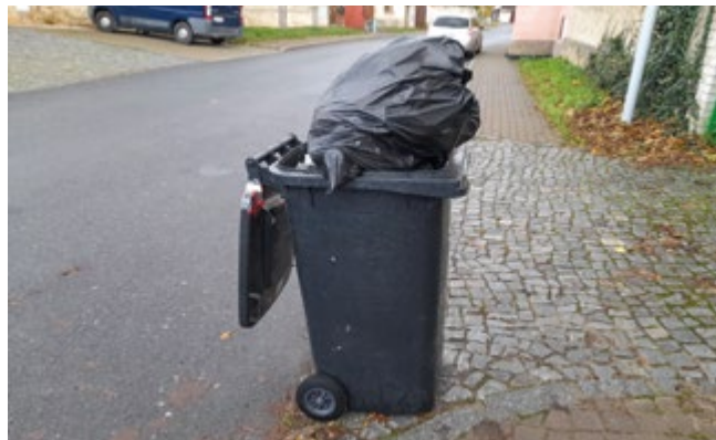
Takto přeplněná nádoba nebude vyvezena

U nádob na tříděný odpad bývá hlavním důvodem nevyvezení, že nádoba obsahuje odpad, který do této nádoby nepatří.