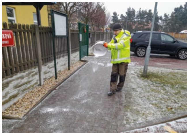
Pan Jan z TS při aplikaci soli na chodníku před školkou

Velký problém na komunikacích způsobila ledovka, která se vytvořila po rychlém oteplení. Sníh tak rychle tál, ale zem byla stále promrzlá. Navíc mírně přšelo. Díky tomu se na komunikacích vytvářela ledovka. Technické služby tak musely použít větší množství posypové soli. Na frekventovaných chodnících, jako je například v okolí školských zařízení, byla po použití soli a roztání ledové vrstvy odstraňována rozbředlá vrstva, aby byla v těchto místech zajištěna maximální bezpečnosti chodců a také pohodlné používání chodníků bez rizika velkého promáčení bot.