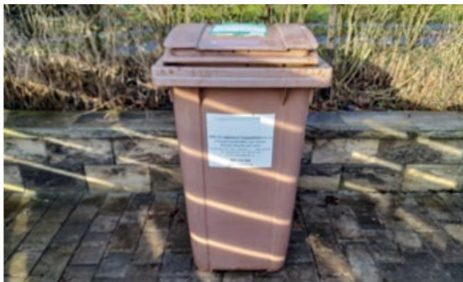
Nádoba na bioodpad

okamžitě informovat (Mobilní rozhlas, webové stránky) o postupu pro podepsání nové smlouvy a případné výměny nádoby.