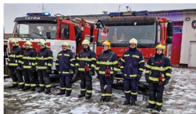
Minuta ticha jednotky SDH Šestajovice