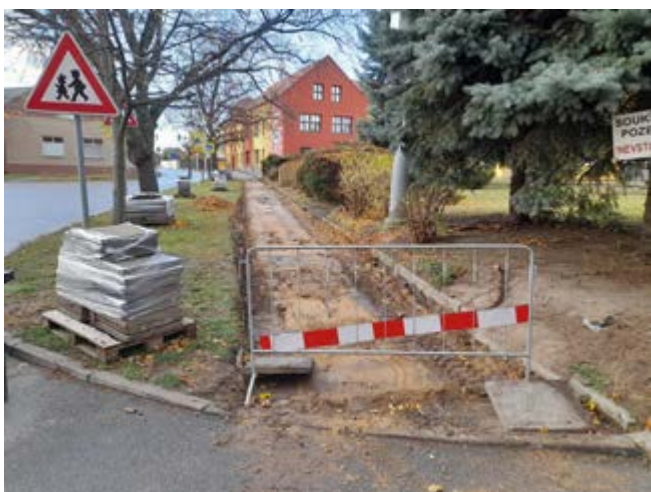
Stará dlažba již byla odstraněna

Ihned poté, co technické služby obce dokončily rekonstrukci a rozšíření chodníku vedoucího od kruhového objezdu k základní škole, začaly TS s rekonstrukcí dalšího chodníku. A opět v těsné blízkosti základní školy. Tentokrát v opačném směru, tedy ve směru na Jirny. Tento chodník byl doposud tvořen starou betonovou dlažbou. Technické služby tuto dlažbu odstranily. Dále začaly odstraňovat staré obrubníky. Práce během prosince přerušilo silné sněžení. Nyní budou TS v pracích pokračovat. Bude dokončeno odstranění starých částí chodníku. Vybudují se nové obrubníky, udělá se nový podklad a položí se nová zámková dlažba.