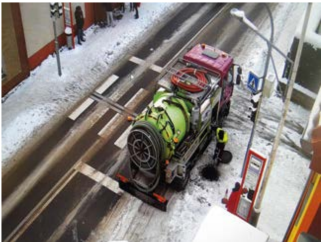
Čištění ucpané kanalizace v ulici Komenského

Žádáme proto občany, aby do splaškových odpadů (toaleta, dřezy, umyvadla, vany apod.) nevhazovali vlhčené ubrousky, hygienické potřeby, jiné pevné předměty, zbytky jídel, olej apod. Děkujeme.