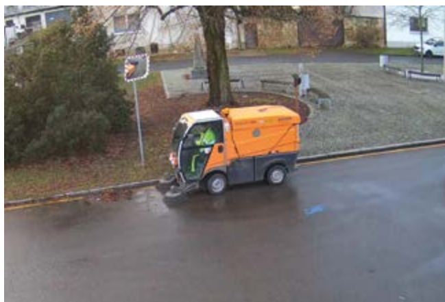
Pan Luděk z TS při zametání inertního posypu z komunikací

Inertní materiál má tu nevýhodu, že po opadnutí sněhu tento materiál zůstává na silnici a může odlétnout od kol jezdoucích vozidel. Proto je nutné tento materiál po opadnutí sněhu ze silnic co nejdříve odstranit. K tomu je nutné opět přestrojit zametací vůz. Takto se zametací vůz musí přestrojit kvůli údržbě komunikací v zimním období opakovaně.