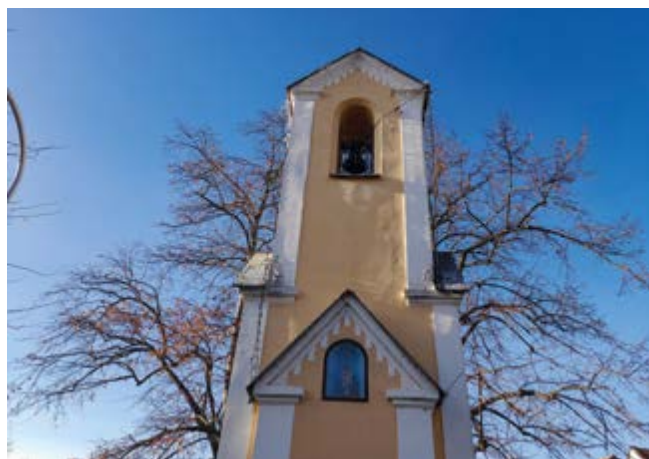
Údery zvonu uctily památku obětí

Vyjadřujeme soustrast pozůstalým a přejeme si, aby událost zůstala ojedinělým excesem, který se již nikdy nebude opakovat.