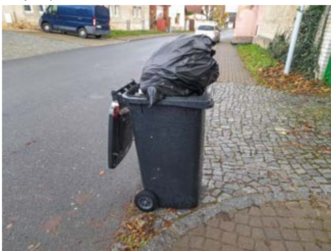
Takto přeplněná nádoba nebude vyvezena

U nádob na tříděný odpad bývá hlavním důvodem nevyvezení, že nádoba obsahuje odpad, který do této nádoby nepatří.