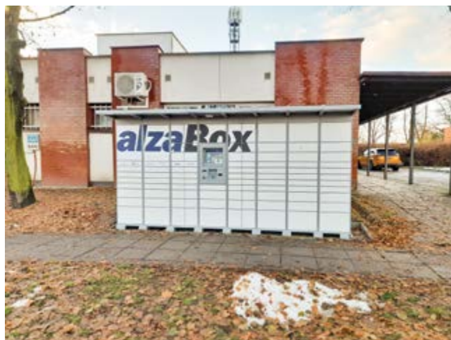
Nový AlzaBox v ulici Tyršova

Pro občany je tak tato služba opět o něco dostupnější a obec získá do obecního rozpočtu finanční prostředky z nájmu za umístění boxu.