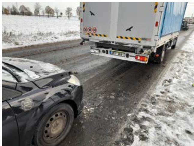
Jedna z prosincových nehod v ulici Poděbradská

Jako velmi špatné se také ukázalo chování některých řidičů při řízení dopravy u nehody. Tito řidiči často z nepozornosti, ale i z bezohlednosti, způsobovali další komplikace. Např. při řízení provozu našimi strážníky u nehody v ulici Poděbradská se řidič vozidla pokusil vyjet z řady čekajících vozidel. Jakmile ale uviděl strážníka, prudce zabrzdil. Do tohoto vozidla pak zezadu