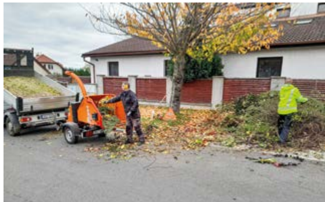
Pan Jan a Jan z technických služeb při štěpkování větví

Drobný bioodpad, jako je listí, tráva nebo roští, se házelo přímo do kontejnerů. Větší bioodpad, jako jsou napří-