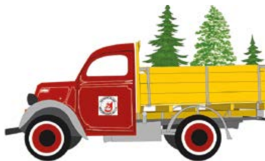
Svoz stromků bude probíhat 8. 1. 2024

Svoz vánočních stromků bude probíhat od pondělí 8. 1. 2024 od 7:00 hodin . Pokud máte zájem o odvoz stromku, je třeba, aby v tuto dobu byl již před domem. Svoz bude probíhat postupně. Stromky je možné nechat před domem tak, aby neomezovaly silniční provoz a chodce. Stromky je také možné odevzdat ve sběrném dvoře.