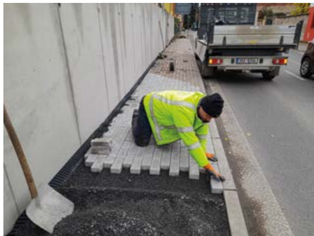
Pan Jan z TS při budování chodníku poblíž školy

Po vybudování nového plotu tak bylo možné začít s rekonstrukcí a rozšířením původního chodníku. Kromě samotného plotu se také čekalo, až odborná firma přemístí rozvodný sloupek pro elektřinu. Proto technické služby obce nemohly původně dokončit celý chodník. Poslední listopadový den dokončily poslední tři metry