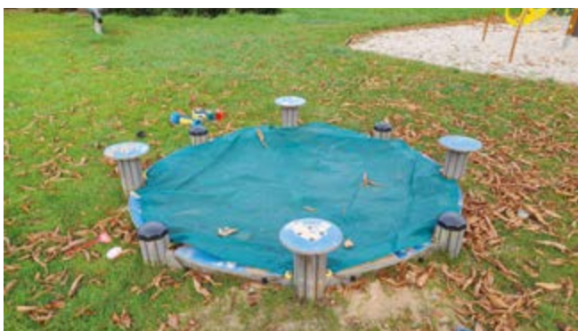
Nová ochranná plachta pískoviště na DH U Vrby

Žádáme návštěvníky dětských hřišť, aby při odchodu z dětského hřiště vždy pískoviště ochrannou plachtou zakrývali. Děkuje.