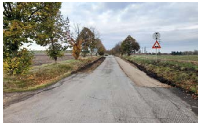
Úpravy základů silnice v ulici Revoluční

V rámci rekonstrukce byl vyfrézován starý asfalt. Zpevnily se krajnice, nová silnice tak je reálně o něco širší. Kde je to bylo potřeba, došlo k zpevnění základů silnice. Nakonec byl položen zcela nový asfaltový povrch. Tím byly dokončeny rekonstrukce hlavních silnic v naší obci a naše obec tak má na svém katastru všechny hlavní silnice ve velmi vysoké kvalitě.