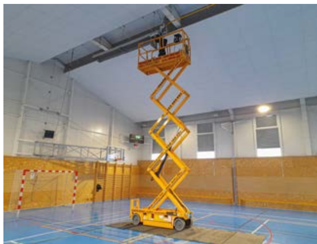
Kontrola plynových zářičů ve sportovní hale

Vzhledem k tomu, že zapůjčení takové plošiny není levná záležitost, využívá se její přítomnost i k údržbě tělocvičny . Např. letos se odstraňoval prach z vnitřní římsy a rohů kolem oken.