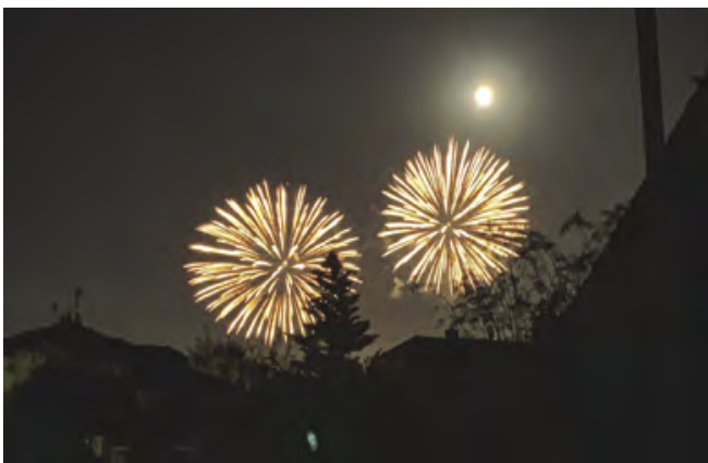
Ohňostroj rozsvítil nebe nad Šestajovicemi

Vesnička je v průběhu roku neviditelná a objevuje se jen v tento den. Především děti byly nadšené z malých domečků, které zde svítily do tmy. Světlušky si pro děti připravily překvapení. Opodál své vesničky vysadily houby, na které rostou lízátka. A každé dítě, které sem přišlo, si mohlo jedno lízátko utrhnout.