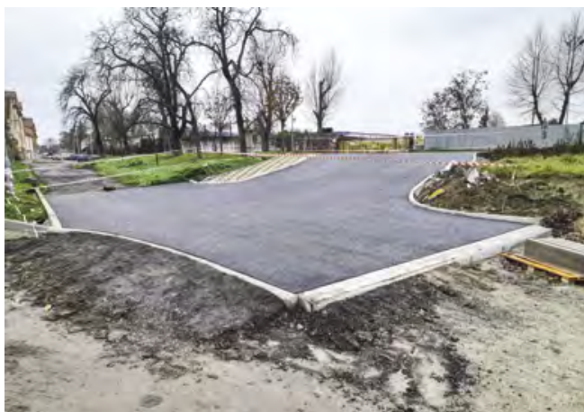
Nová křižovatka ulic Komenského a Nad Údolím

Letos byl dokončen první úsek. Tento úsek má podobu nové části napojení na hlavní silnici a křižovatky s ulicí Nad Údolím. Místo má nový asfaltový povrch vč. chodníku. Na jaře budou pokračovat práce na dalším úseku, který bude v ulici Nad Údolím. Zde bude povrch vozovky tvořit zámková dlažba. Součástí komunikace budou také nová parkovací místa.