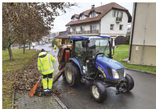
Vysávání listí nahromaděného fukarem

Podzimní úklid veřejných prostranství představuje především úklid listí. Listí se z veřejných prostranství uklízí až po ukončení jeho spadu. Letos úklid začal v polovině listopadu. Úklid provádějí technické služby obce.