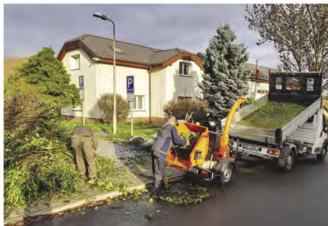
Zaměstnanci TS při zpracování větví

Obsah kontejnerů se odváží na kompostování. Větve se štěpkují přímo na místě a štěpka je dále využívána v obci. V letošním roce bude např. využita jako nový materiál dopadových ploch vybraných herních prvků