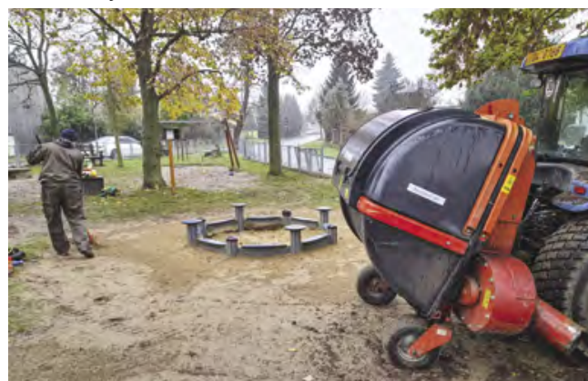
Listí se odklízí i z dětských hřišť