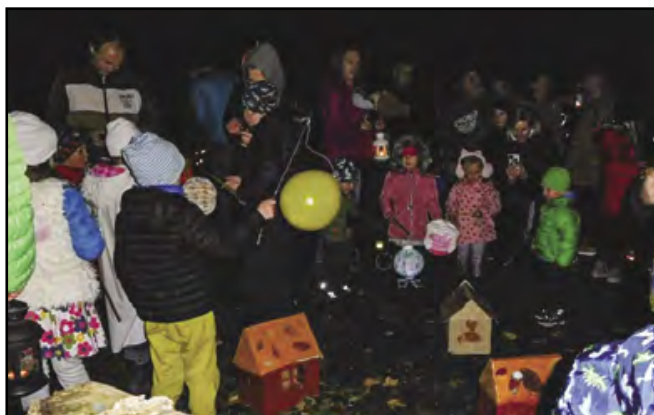
Děti obdivovaly malé domečky světlušek