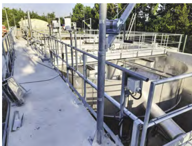
Nově přistavěná část čistírny odpadních vod

Nyní dojde ke kolaudaci pro zahájení zkušebního provozu, ve kterém bude ČOV následně provozována. Po skončení zkušebního provozu, tj. v průběhu příštího roku, dojde k závěrečné kolaudaci stavby.