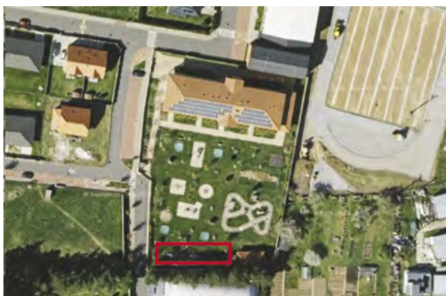
Umístění nové budovy školky

Obec již zakoupila projekt na budovu. Na příslušný stavební úřad již byla podána žádost o stavební povolení. Obec na výstavbu nové budovy MŠ podala žádost o dotaci, a to na Ministerstvo pro místní rozvoj, 7. výzva IROP – Mateřské školy – SC 4.1. Celková výše nákladů je 30.816.493 Kč, výše požádané dotace je 90 % nákladů.