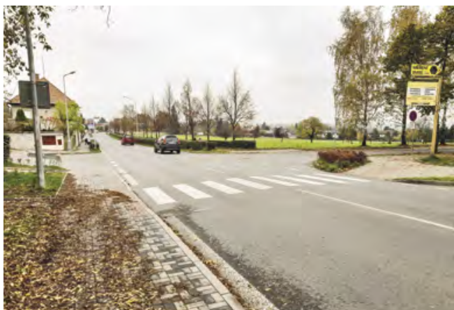
Tato křižovatka bude mnohem bezpečnější

dokumenty. Obec se také pokusí získat na vybudování semaforu dotaci. K samotné stavbě dojde po vydání stavebního povolení, dá se tak předpokládat že v průběhu příštího roku.