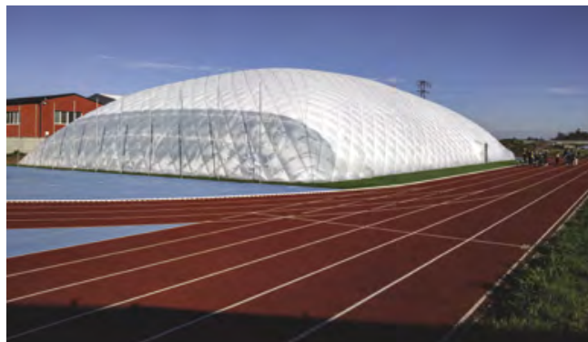
Nová nafukovací hala v atletickém areálu

Malá nafukovací hala, která se vždy stavěla na hřišti u základní školy, nebude letos postavena. Důvodem je nadměrný nárůst cen energií, na které jsou nafukovací haly velmi náročné. Dopltek obce na provoz malé nafukovací haly by tak byl neúměrně vysoký.