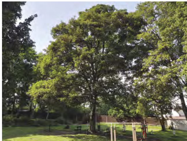
Koruna tohoto stromu musela být opatřena úvazem

Kompletní ošetření bylo během prázdnin provedeno u stromů, které se nacházejí v parku na Balkáně , a dále u stromořadí lip , které probíhá začátkem ulice Tyršova a dále směrem ke sportovnímu areálu. Ošetření bylo náročné, jelikož se jedná o velmi staré stromy. Díky důkladné péči o tyto stromy však dojde k významnému