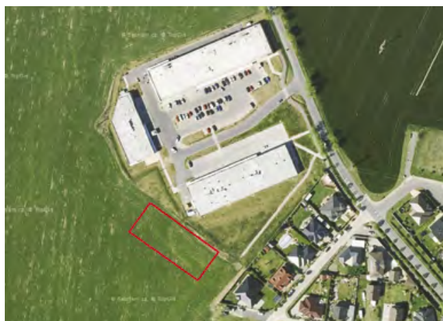
Vymezení prostoru pro stavbu nového obchodu

Anketa bude otevřena od 1. 9. do 30. 9. 2022.