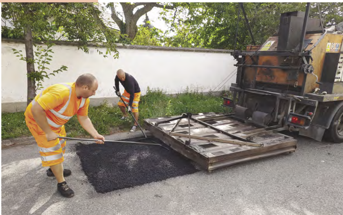
Přes prázdniny probíhaly opravy místních komunikací