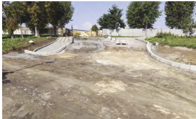
Nové propojení s ulicí Nad Údolím

Nyní se zde buduje nový povrch , který bude tvořen zámkovou dlažbou . Stavebně bude mít ulice podobu obytné zóny . Tedy bude mít zálivy a vyznačená parkovací místa. Spolu s novým povrchem této ulice je budován i nový nájezd na tuto komunikaci z ulice Komen-