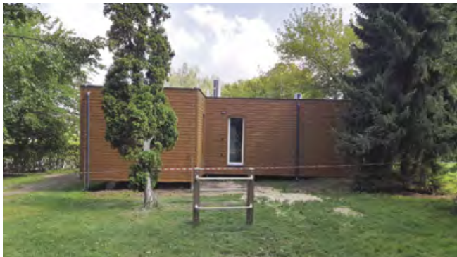
Budova zapadá do prostředí parku

Budova ordinace byla koncipována tak, aby vhodně zapadla do prostoru parku . Její fasáda je tvořena tmavým dřevem, které splývá s přírodním prostředím. Jednotlivé moduly domu byly umístěny tak, aby v parku nedošlo ke kácení dřevin . V budoucnu, po přemístění ordinace do konečného prostoru ve společenském centru, budou moduly odvezeny a park bude moci být dán do zcela původního stavu.