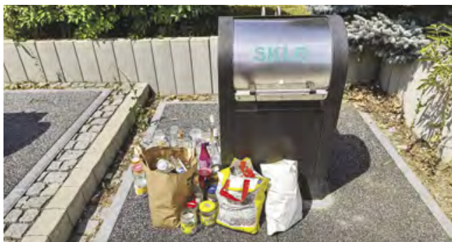
Nepořádek u kontejneru na tříděné sklo

Někdy jsou zde lahve položeny v taškách z důvodu, že dotyčnému se nechtělo jednotlivé lahve vyhazovat do otvoru, a tak zde tašku položil. Druhým důvodem bývá, že je hrdlo kontejneru ucpané (stává se u bílého skla – konstrukční záležitost) a uživatelé proto bílé sklo odloží vedle kontejneru. Zde připomínáme zásadní pravidlo: Barevné sklo se nesmí házet do bílého skla, ale bílé sklo je možné vyhazovat do barevného skla . Otvor na barevné sklo se neucpává. Proto pokud bude otvor na bílé sklo ucpan, je možné bílé sklo vhodit do otvoru na barevné sklo . Stejně tak je zakázáno pokládat vedle kontejnerů sklo, které se nevejde do otvoru kontejneru. Toto nadměrné sklo se odevzdává ve sběrném dvoře. V souvislosti s odkládáním skla , stejně jako jiných tříděných odpadů , mimo kontejnery upozorňujeme, že takové jednání je porušováním obecně závazné vyhlášky . Všechna kontejnerová stanoviště jsou pod dohledem kamer. Pachatelé tohoto přestupku jsou dohledáváni na kamerovém záznamu a následně je jim udělována bloková pokuta .