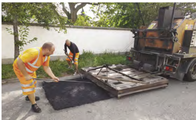
Metoda opravy komunikací tzv. „žehličkou“

Opravy je možné provádět různými metodami. Naše obec používá metodu tzv. „žehličky“. Jde o zařízení, které roztaví původní poškozenou část asfaltu. Takto rozehřátý povrch se naruší hráběmi a je do něj přidána vrstva nového kvalitního asfaltu. Povrch je následně uválcován vibračním válcem. Při této metodě dochází k propojení původního povrchu s novým asfaltem, aniž by vznikaly spáry. Jde o velmi kvalitní metodu opravy . Tato metoda je sice dražší, ale opravy provedené touto metodou mají velmi vysokou trvanlivost. Opravené místo tak není třeba po krátké době opět opravovat. Z dlouhodobého ekonomického hlediska je tak daleko výhodnější využít tuto dražší, ale mnohem účinnější a trvanlivější metodu oprav.