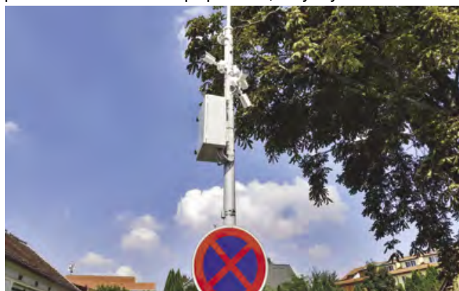
I tyto kamery pomohly identifikovat pachatele přepadení

Během prázdnin se díky kamerovému systému podařilo dohledat viníky dvou dopravních nehod. Tito pachatelé způsobili škody našim občanům a z místa nehody uješli. Oba pachatele se podařilo na kamerovém záznamu dohledat a získat tak usvědčující materiál. Stejně tak se díky kamerovému systému podařilo dohledat a identifikovat pachatele loupežného přepadení. Kamery již posloužily i v dalších případech, kdy bylo kamerového