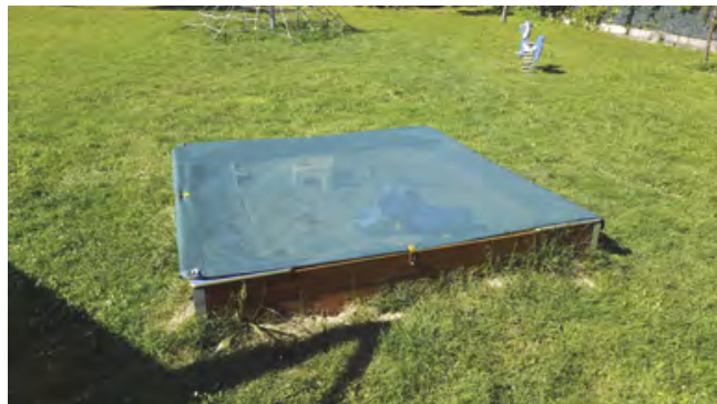
Nová krycí plachta pískoviště na dětském hřišti U Valu

Prozatím byla umístěna jedna plachta na pískovišti na dětském hřišti U Valu. Podmínkou pořízení plachet na ostat-