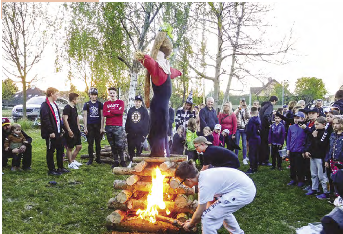
30. 4. 2022 – zálesáci z TJ Sokol Šestajovice zapalují hranici s čarodějnicí