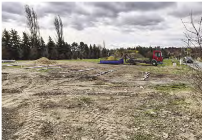
Příprava základových patek

Také byly zabudovány první základové patky pro nové domy. Jako poslední bude výstavba modulových domů provedena na pozemku, kde se nachází pumptracková dráha. Nová dráha bude umístěna v rámci atletického areálu, jehož výstavba právě probíhá.