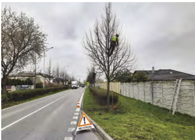
Ošetřování lip podél hlavní silnice

V posledních letech obec na svém území vysázela stovky nových stromů a tisíce nových keřů. Samotnou výsadou však starost se zelení nekončí. Každý strom je třeba jednou za tři roky nechat zkontrolovat dendrologem a provést na něm výchovné a zdravotní řezy. Proto obec každý rok objedná odbornou firmu, která tyto práce provede vždy v jedné třetině obce. I letos takto došlo k ošetření stromů v části Šestajovic. Některé dendrologické práce budou ještě pokračovat v průběhu května.