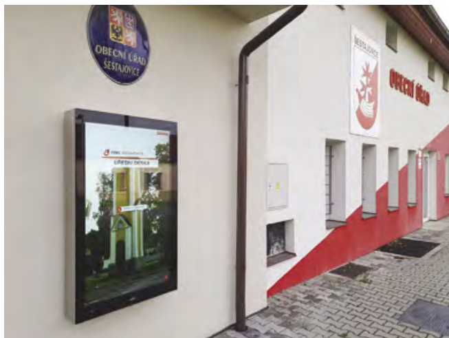
Nová elektronická deska je již v provozu

Z důvodu velkého množství informací, které je třeba ze strany obce zveřejňovat, došlo k pořízení nové elektronické úřední desky. Na původní „pevné“ úřední desky se velké množství informací často ani nevešlo.