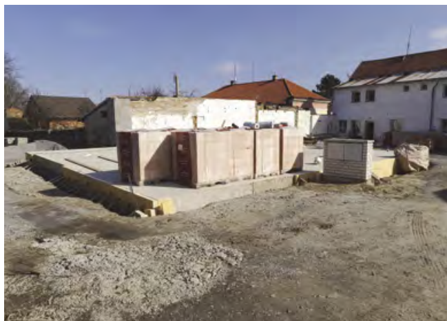
První patro nové budovy již stojí

Budova je majetkem obce. Její provoz je však velmi nákladný. Díky své konstrukci je budova energeticky velmi náročná a je ve velmi špatném technickém stavu. Zadní budova již chátrala a byla využívána pouze jako skladovací prostor. Obec se proto rozhodla tyto budovy zbourat a vystavit zde budovy nové. V nových budovách budou bytové jednotky. Po dokončení výstavby se obec dle ekonomické situace rozhodne, zda část bytů prodá, aby se vrátily náklady na výstavbu nebo zda si všechny byty ponechá. Obec bude tyto byty pronajímat, aby měla