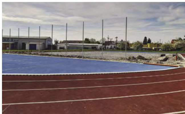
Již stojí sloupy pro ochranné síť

Pokračují práce na výstavbě nového atletického areálu. Byla vybudována základová vrstva pro nové hřiště s umělým povrchem, které se bude nacházet ve vnitřní části běžeckého oválu. Hlubí se výkopy pro rozvod instalací inženýrských sítí. Již byly také zabudovány sloupy, které budou nést síť sloužící jako ochrana proti odlétávání míčů z herní plochy multifunkčního hřiště.