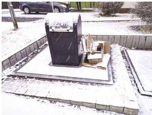
Tento papír je již znehodnocen

V souvislosti s využíváním podzemních kontejnerů na tříděný odpad žádáme občany , aby do hrdla kontejneru vhazovali papír a plast o velikosti, která hrdlem projde . Především u kontejnerů na tříděný papír jsou hrdla často ucpaná, protože se někdo snaží hrdlem procpat velký kus kartonu, nejčastěji kartonové krabice. Hrdlo se tímto ucpe, a ačkoliv je kontejner prázdný , ostatní občané ho nemohou využít. Děkujeme za pochopení a ohleduplnost vůči ostatním občanům.