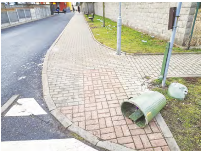
Zničený koš u budovy MŠ

I škody na veřejném majetku byly po letošních oslavách minimální. Jeho poškození bylo zaznamenáno pouze u odpadkového koše u budovy mateřské školy. Do tohoto koše vhodil pachatel zábavní pyrotechniku, která výbuchem koš roztrhla a jeho části vč. obsahu koše rozmetala po okolí. Nebezpečné pro chodce pak bylo vel-