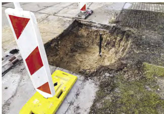
Havárie byla opravena během několika hodin

V zimním období jsou opravy havárií na vodovodním řadu obzvláště nepříjemné. Nicméně tyto havárie je vždy třeba opravit co nejrychleji, aby byla zajištěna dodávka vody do domácností nebo nedocházelo k únikům vody z řadu. Začátkem prosince se s jednou takovou opravou potýkali zaměstnanci technických služeb v ulici Smetanova. Zde došlo k závadě na přípojce a z vodovodního řadu tak začala unikat voda. TS nejdříve museli odstranit kus betonové konstrukce vozovky. Poté vyhrabat zeminu a opatrně odkrýt místo havárie. Následně došlo k opravě poškozeného místa. Ještě týž den bylo místo opět zavezeno pískem a zeminou a bylo připraveno k obnovení vozovky.