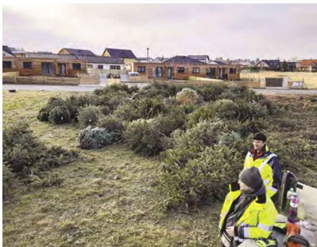
Zaměstnanci TS svezli a zpracovali stovky stromků

Aby bylo štěpkování bezproblémové, musí být stromy zcela odstrojeny. K tomuto přistoupili naši občané velmi odpovědně. Skoro všechny stromky byl zbaveny ozdob a tvořili tak čistý bioodpad. Za tento odpovědný přístup našim občanům děkujeme. Mezi stovkami stromků se skutečně našlo pouze pár jednotek kusů stromků, jejichž majitelé se zachovali bezohledně vůči životnímu prostředí a zaměstnancům technických služeb a stromky vyhodili na ulici neodstrojené.