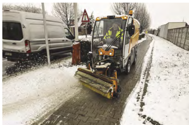
Zametání chodníků po prvním sněhu

I když chladného počasí se sněhem jsme se letošní zimu zatím moc nedočkali, jsou technické služby obce stále připraveny na zimní úklid . Především musí být připravena technika, na kterou jsou na zimu instalovány radlice a zametáky. Technika zatím za účelem odklizení sněhu vyjela pouze na pár dní v průběhu prosince. Sněhu nebylo mnoho, úklid byl proto prováděn především v podobě zametání chodníků. Zima ale ještě nekončí, i ostatní techniku určitě ještě letos čeká mnoho práce.