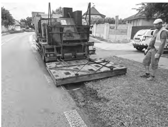
„Žehlička“ při nahřívání původního asfaltu