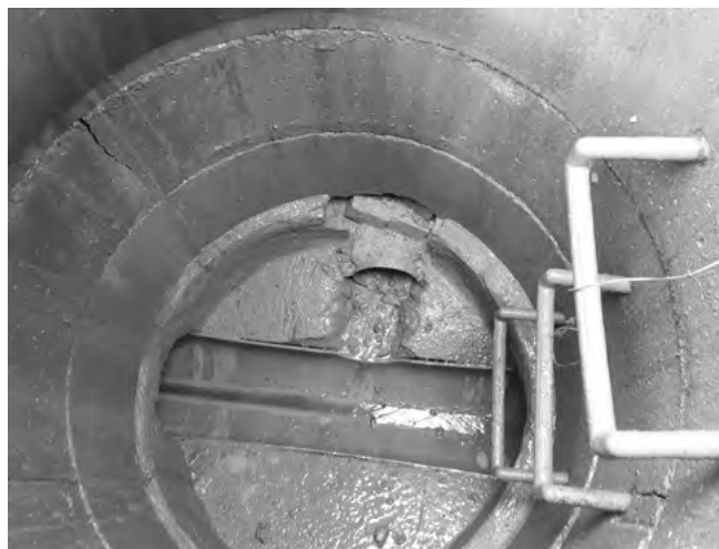
Špatně provedené napojení přípojky kanalizace