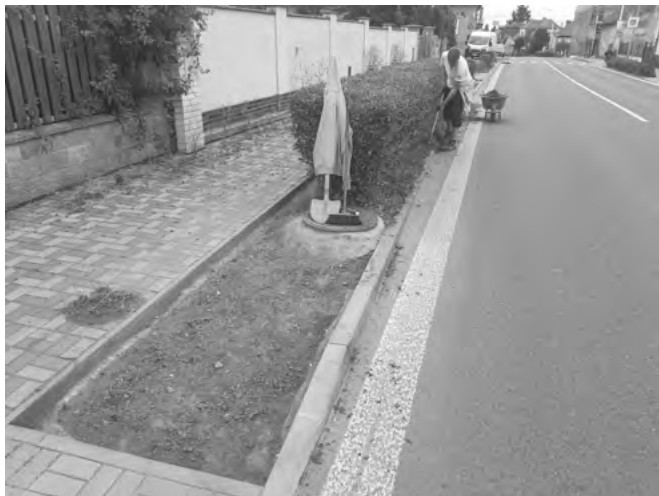
Nově revitalizovaný úsek zeleně

zimou budou tyto úpravy provedeny v části po vodní nádrž Beranka.