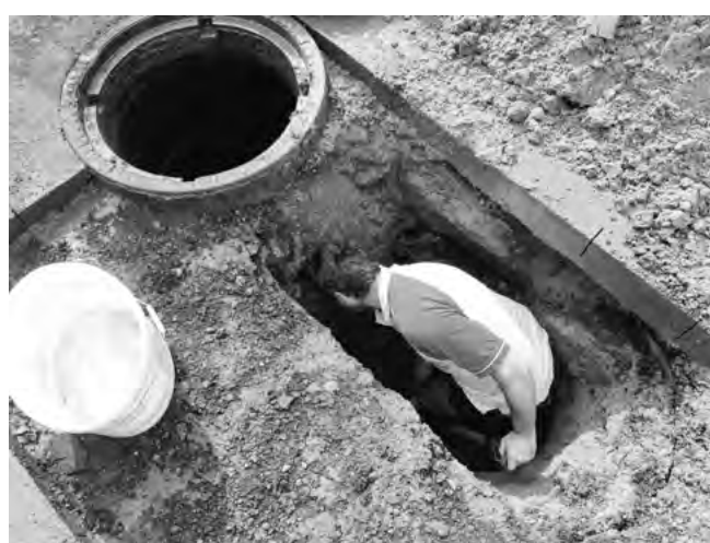
Těžká práce v omezeném prostoru