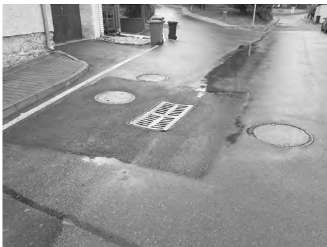
Místo po provedení opravy