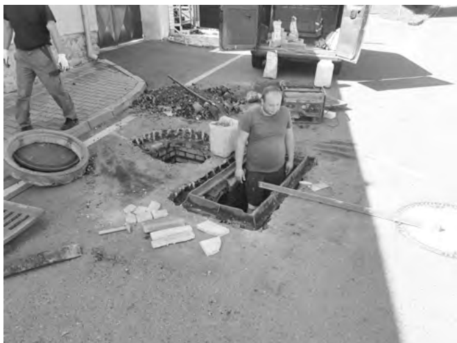
Vyrovnaní propadlé vpusti dešťové kanalizace