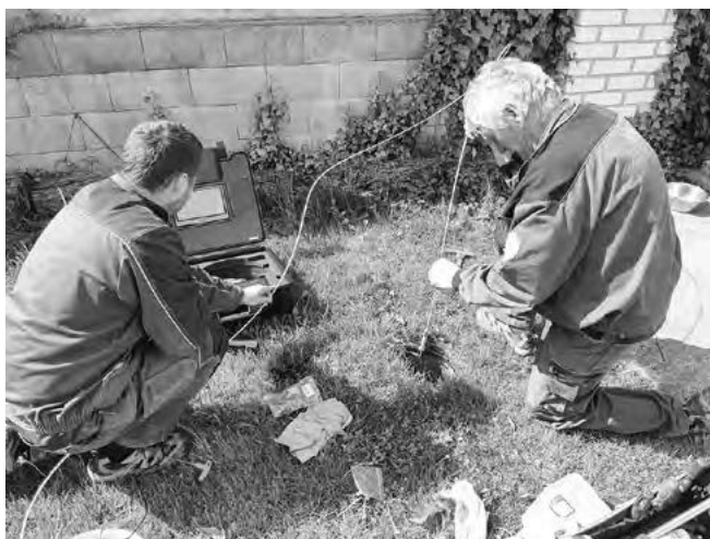
TS při hledání poškození kanalizace za pomoci nové kamery.

Jedním ze strategických směrů, který vedení naší obce aplikuje při rozhodovacích procesech, je zajištění maximální soběstačnosti obce . Soběstačnost vede především k úsporám , které vznikají vlastním zajištěním hospodářských činností v obci a tím omezením využívání