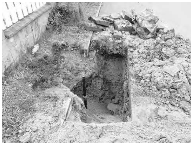
Místo havárie po provedení opravy

V neděli 23. 5. byla zjištěna havárie na vodovodním řadu v ulici Trativody. V neděli je většina občanů doma a náhlé přerušení dodávky vody by pro ně znamenal nemalé problémy . Proto v neděli provedly technické služby obce na místě preventivní opatření, aby nemuselo k okamžitému přerušení dodávky