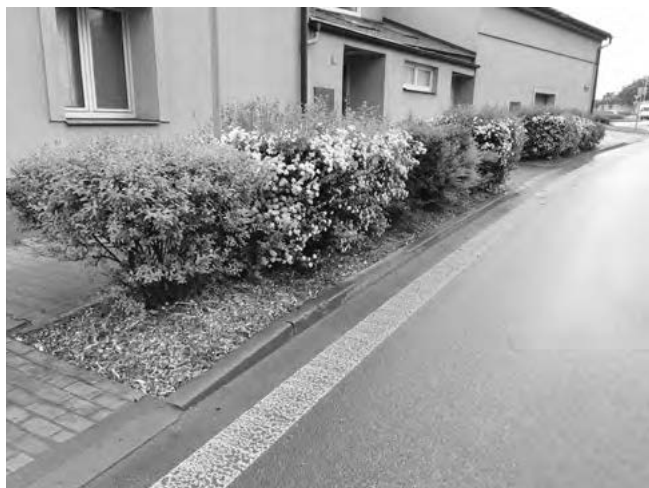
Štěpka zajistí keřům vláhu a živiny

Technické služby obce pokračují v revitalizaci zeleněho pásu podél hlavní silnice. Jedná se o místa, kde jsou vysázeny živé ploty podél hlavní komunikace. Prvním ošetřeným místem byl živý plot u hlavní silnice v ulici Revoluční před kruhovým objezdem. Okolo keřů byl odkopán nános zeminy, který omezoval spodní část keřů . Odstranění této přebytečné zeminy pomůže i ke zvýšení čistoty a ke snížení prašnosti v okolí. Za dešťů totiž byla tato zemina splavována na chodní-