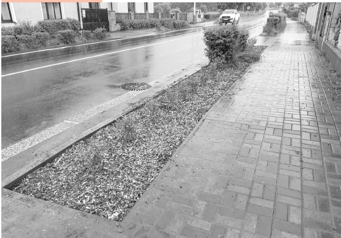
Nové keře doplňující stávající zeleň v okolí hlavní silnice