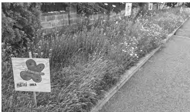
Luční porost na veřejném prostranství

Tyto veřejné pásy zeleně udržují technické služby obce. Aby vznikl žádoucí luční porost, nesmí se místo pravidelně sekat. Proto pokud má občan zájem o využití veřejného pásu zeleně jako louky , je třeba toto nahlásit technickým službám obce na email technickeslužby@sestajovice.cz . Zaměstnanci technických služeb pak tato místa na žádost občanů nesekají a přenechávají je jejich údržbě.