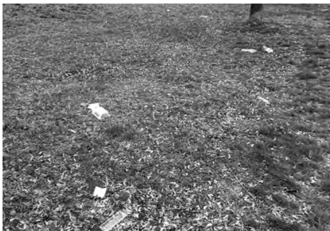
Odpad rozfoukaný větrem od kontejnerů

Opakované žádosti naší obce o správné používání kontejnerů nejsou vyslyšeny . Naopak nepovolené