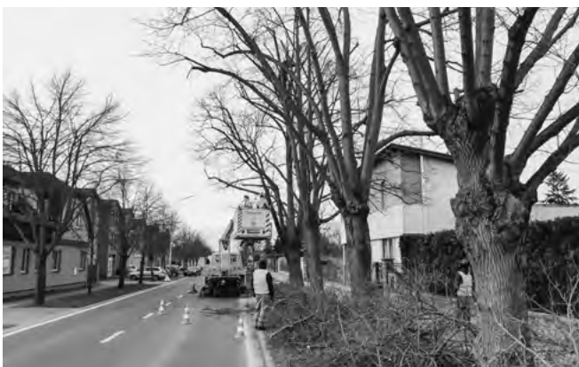
Ošetřování stromů dendrologem

V posledních letech naše obec vysadila okolo 2 000 nových stromů . Nejen o tyto nové stromy, ale i o ty původní, je třeba dobře pečovat . Naše obec nechává každý strom jednou za tři roky zkontrolovat odborníkem v oblasti dendrologie. Na stromech jsou během těchto kontrol prováděny zdravotní řezy. Během letošních kontrol dendrolog zkontroloval a ošetřil stromy ve východní a jižní části obce. Zdravotní řezy byly také provedeny na starých lipách u jižní části hlavní silnice.