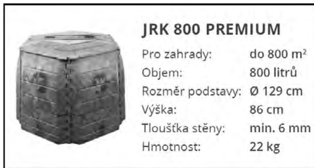
Nový kompostér pro naše občany zdarma

Naše obec stále hledá a zavádí nové možnosti, jak občanům co nejvíce zlepšit podmínky pro třídění odpadů. Například v loňském roce získali naši občané od obce zdarma do výpůjčky plastové nádoby na tříděný papír a plast. Podobnou možnost se podařilo zajis-