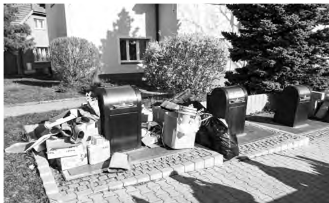
Obrázek připomínající spíše dálný východ

odkládání odpadů mimo nádoby přibývá , stejně tak přibývají stížnosti občanů. Proto je naše obecní policie nucena přistoupit v případech tohoto jednání k udělování blokových pokut. Pro zjištění pachatelů této činnosti používají strážníci fotopasti a další pátrací metody . Pachatelé jsou pak dohledáni nejen podle obličejů, ale také podle registračních značek vozidel. Příkladem může být hromada odpadu, který byl odložen vedle kontejnerů v ulici Husova (viz foto). Strážníci na základě šetření zjistili šest různých pachatelů, kteří zde odpad odložili. Pět z těchto pachatelů byly uděleny blokové pokuty . Jeden pachatel odmítl pokutu zaplatit. Jeho případ byl proto postoupen přestupkové komisi. Odmítnutí pokuty se pachatelům velice prodraží. V přestupkovém řízení nejenže zaplatí většinou vyšší pokutu, ale jsou povinni uhradit i náklady řízení (2 000 Kč). Navíc je jim proveden zápis do registru přestupků.