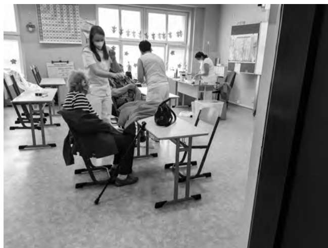
Vakcinace druhou dávkou v naší ZŠ

V současnosti se mezi našimi občany objevilo tvrzení, že výstavba této komunikace začne za dva roky. Jedná se o fámu Aktuálně teprve probíhá posuzování vlivu stavby na životní prostředí. Není stanovena konečná varianta trasování, není kompletní projektová dokumentace, nejsou vykoupěny pozemky atd. Že by byla stavba zahájena za dva roky, je tak zcela nereálné . Navíc v současnosti se v rámci Středočeského kraje nejedná